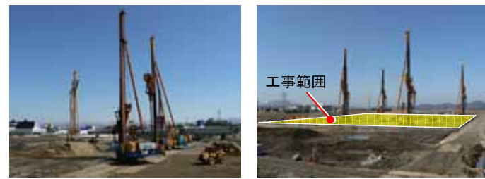
地盤改良工事の様子です（最盛期）

1月中旬からの「病院棟建設地」の地盤改良工事（SAVEコンボイ）が完了しました。