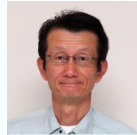
南棟(建築工事) 長橋(現場代理人) 山形建設(株) ・(株)山口工務店JV