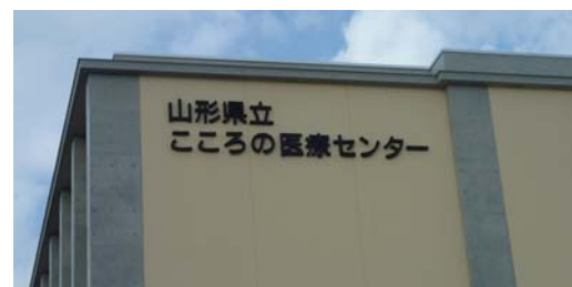
北棟・東側から撮影

工事現場ですが、大詰めを迎え、1階から3階の内部・屋上・外壁等の工事と共に、設備や器具の搬入を行っています。